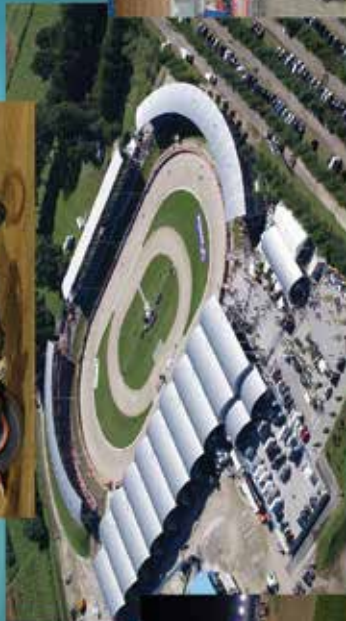
Stadion "Milenium" Donji Kraševac SPEEDWAY KLUB "UNIA"