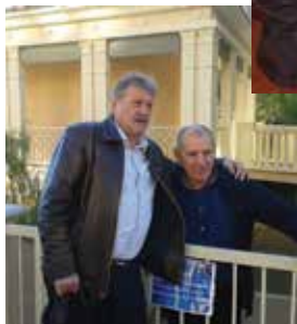
198 Harry EVERTS višestruki svjetski motocross prvak