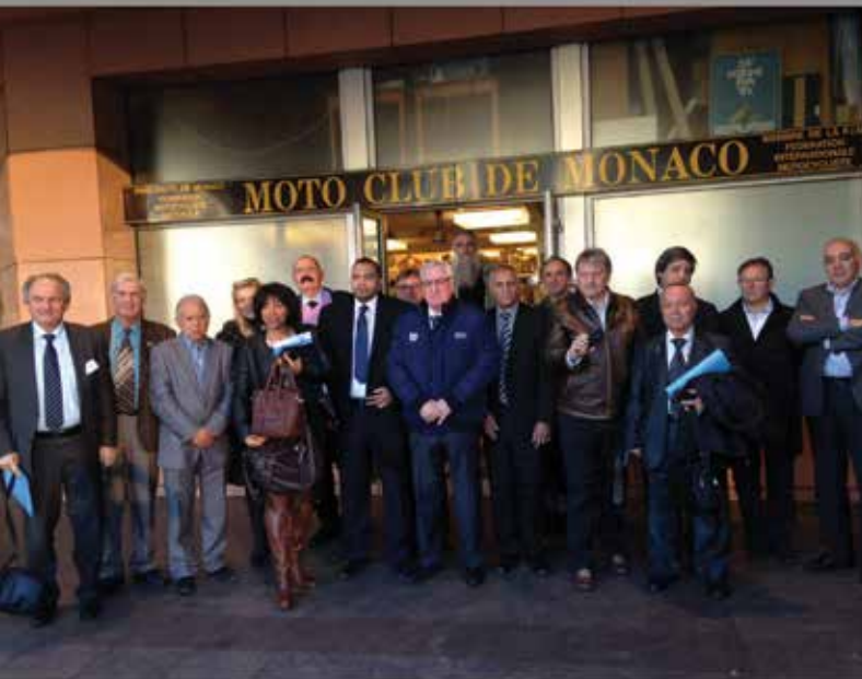
SKUPŠTINA MEDITERANSKE ZONE MONACO, 7. 12. 2013.

Na temelju članka 22. Sportskog motociklističkog pravilnika, Upravni odbor je na svojoj sjednici održanoj 16. 11. 2013. godine donio