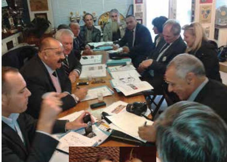
Skupština Mediterranske zone