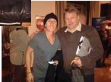
Tony CAIROLI svjetski motocross prvak 2013.