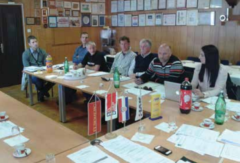
Sjednica Odbora za sport HMS-a u Autoklubu Jastrebarsko