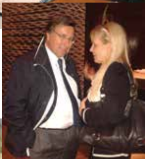
Wolfgang SRB Predsjednik FIM MX